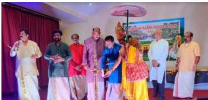
ഹുസ്റ്റൺ റാന്നി അസോസിയേഷന്റെ നേതൃത്വത്തിൽ ഹുസ്റ്റൺ ട്രിനിറ്റി മാർത്തോമ്മാ ദേവാലയ ഹാളിൽ നടന്ന ഓണമാഘോഷ പരിപാടിയിൽ നിന്നും