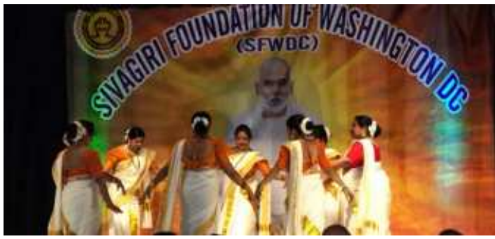
മെരിലാന്റിലെ പോട്ടോമാക് കമ്മ്യൂണിറ്റി സെന്ററിൽ നടന്ന ശിവഗിരി ഫൗണ്ടേഷൻ ഓഫ് വാഷിംഗ്ടൺ ഓണവും ഗുരുദേവ ജയന്തിയും ആഘോഷത്തിൽ നിന്നും